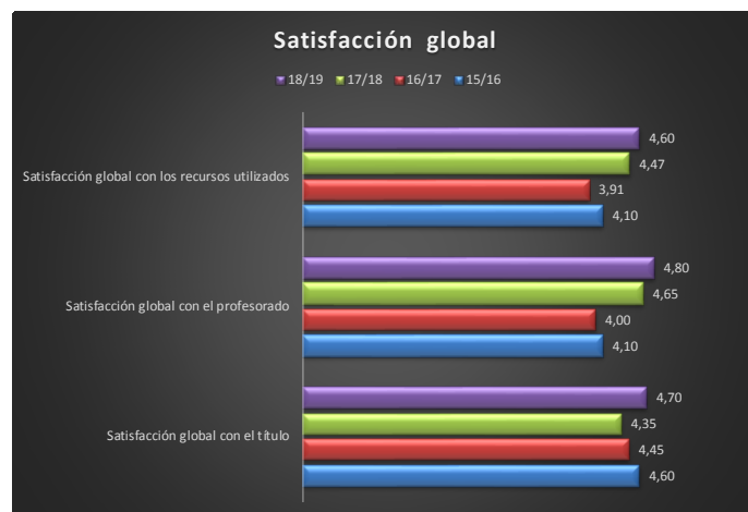
Figura 2. Satisfacción global del estudiantado matriculado en el máster. Cursos 2018/2019, 2017/2018, 2016/2017 y 2015/2016